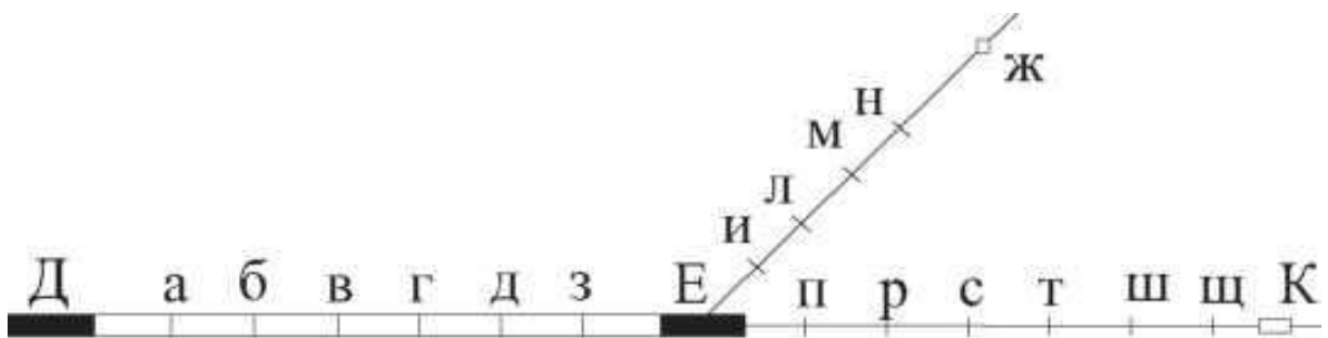
Рисунок 2 Схема полигона железной дороги